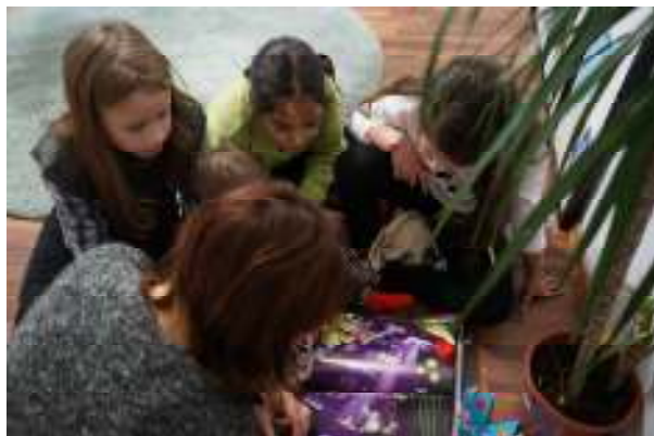
Lucru în echipă e distractiv