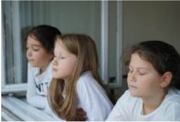
Moment de meditație pentru restabilirea focalizării