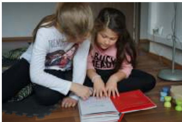
Moment de lectură și cooperare