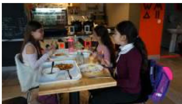
Grija față de ritualul hrănirii