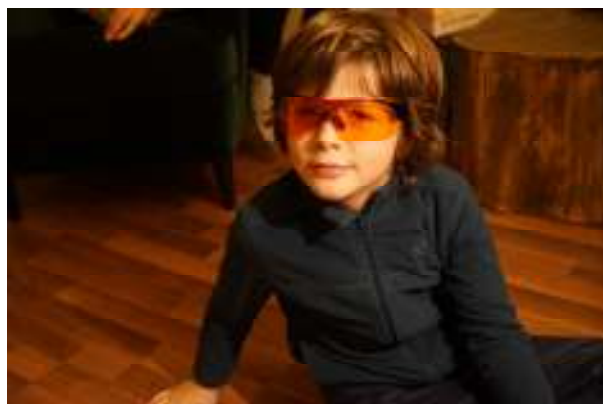
Biohacking - ochelari care filtrează lumina albastră

Întreaga echipă ajută constant la dezvoltarea și derularea programului afterschool în stil Gritty . Redăm, mai jos, o galerie foto care surprinde atmosfera acestui proiect-pilot și, în încheiere, vă invităm să ne cunoaștem și să descoperim împreună alternative educaționale pentru copiii noștri!