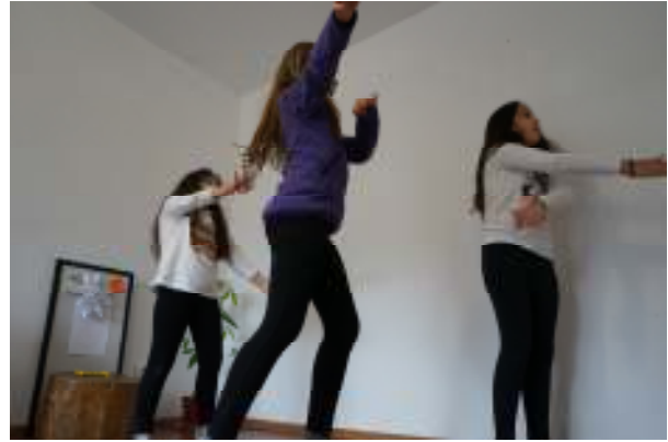
Moment vocațional – pasiune pentru coregrafie