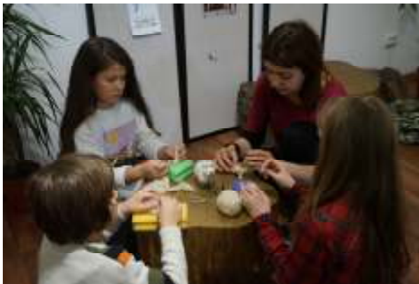
Moment vocațional – abilități practice