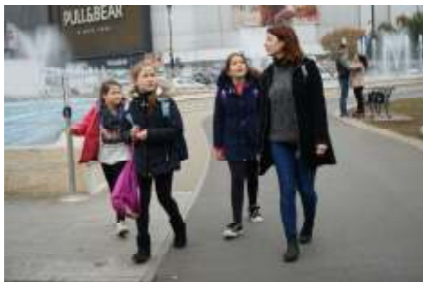
Încurajarea timpului petrecut în aer liber