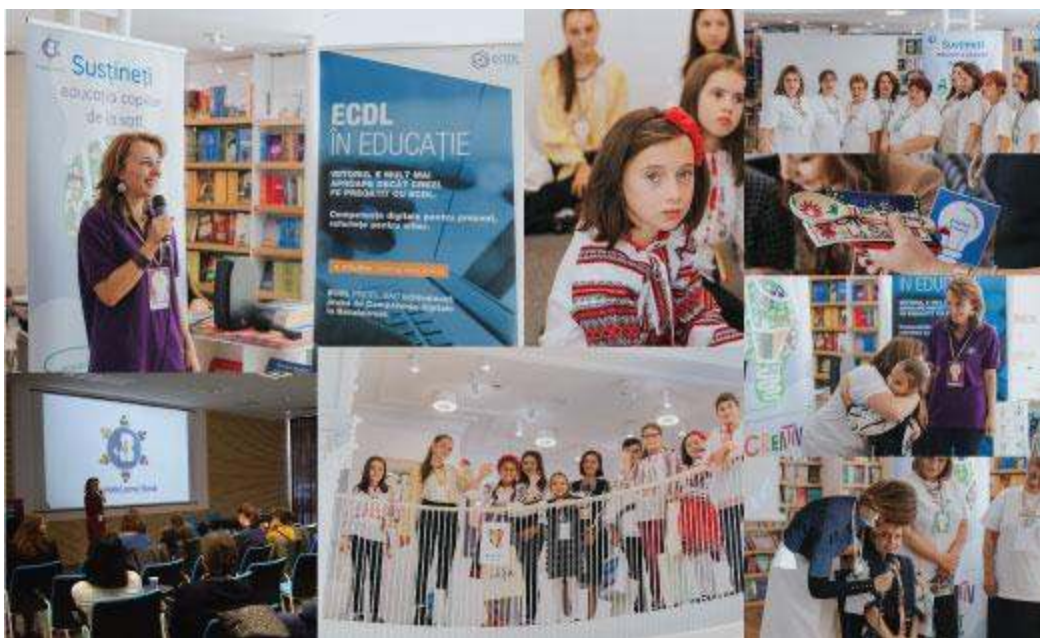
Colaj cu poze de la diferite evenimente de prezentare a Revistei Creativ la Sat