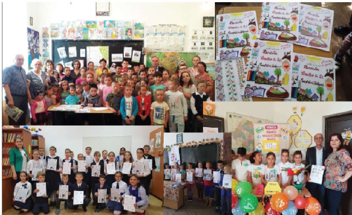
O parte dintre beneficiarii Revistei Creativ la Sat