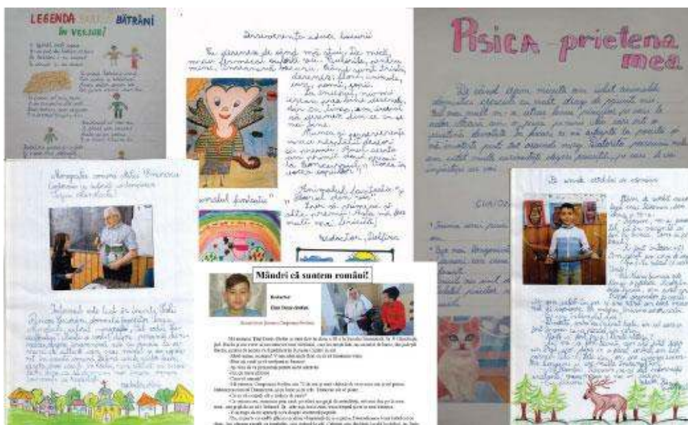
Fragmente din Revista Creativ la Sat

Puteți găsi Revista Creativ la Sat în format PDF pe site-ul www.asociatialembuna.com .